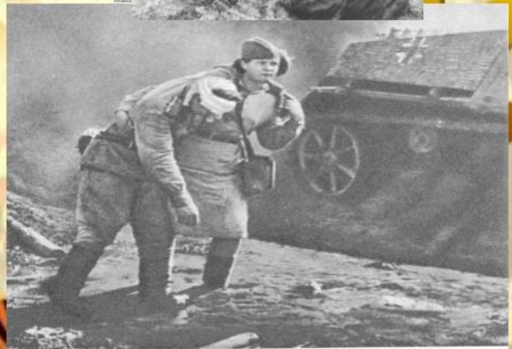
Спасая раненого война...